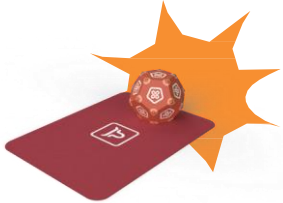
게임 지원 키트